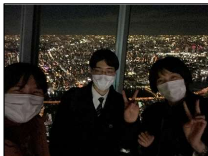
【東京スカイツリー】