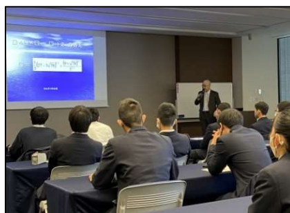
【講義体験(東京大学)】