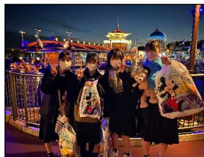
【東京ディズニーリゾート】